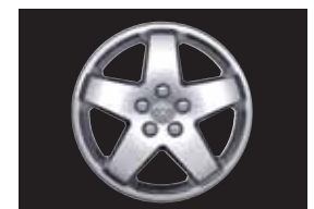
LEICHTMETALLFELGE 7,0 x 18 Zoll, matt, 5-Speichen- Sport-Design, Bereifung 215/55 R18