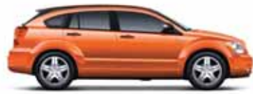
Sunburst Orange Metallic