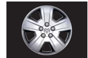
STAHLFELGE 6,5 x 17 Zoll, 5-Speichen-Radzier- blende, Bereifung 215/60 R17