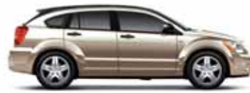
Light Sandstone Metallic