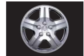
LEICHTMETALLFELGE 6,5 x 17 Zoll, 5-Speichen-Design, Bereifung 215/60 R17