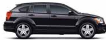
Brilliant Black Metallic