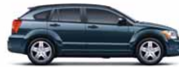
Deep Water Blue Metallic