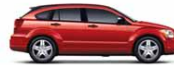
Inferno Red Metallic