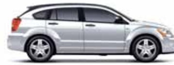
Bright Silver Metallic