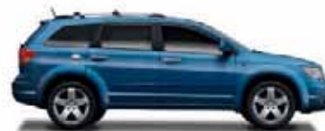
Deep Water Blue Metallic