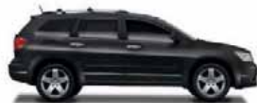
Brilliant Black Metallic