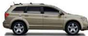
Light Sandstone Metallic