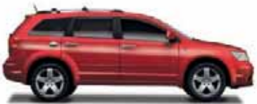
Inferno Red Metallic