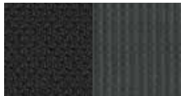
Stoffausstattung Dark Slate Gray (SE)