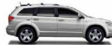
Bright Silver Metallic