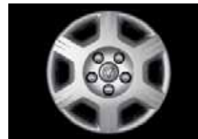
STAHLFELGE 6,5 x 16 Zoll, 6-Speichen-Design mit Radzierblende, Bereifung 225/65 R16