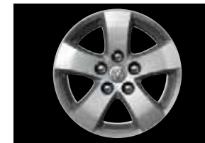
LEICHTMETALLFELGE 6,5 x 17 Zoll, 5-Speichen-Design, Bereifung 225/65 R17