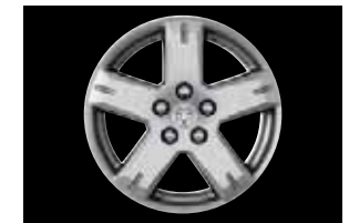
LEICHTMETALLFELGE 7 x 19 Zoll, 5-Speichen-Design, Bereifung 225/55 R19