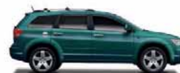
Melbourne Green Metallic