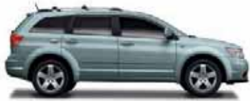
Silver Steel Metallic